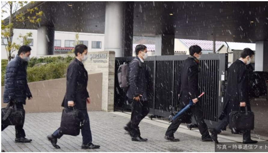
睡眠剤混入問題で、立ち入り調査のため製薬会社「小林化工」に入る厚生労働省や県などの職員=2020年12月21日午前、福井県あわら市

小林化工によると、意識障害などの健康被害は150件を超え、飲んだ70代女性と80代男性が死亡した。服用者が車を運転中に意識を失う交通事故も20件以上起きている。